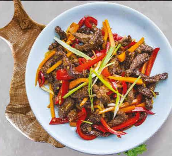
شيلي لحم بقري BEEF CHILLI

Chinese Dry Beef Chilli - Beef strips hot and fragrant Chinese dry beef chilli. Serve hot with boiled noodles or steamed rice.