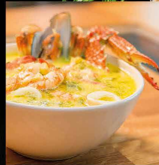
بلوبيس - كريمة بحرية BALLOBAIS CREAM OF SEAFOOD