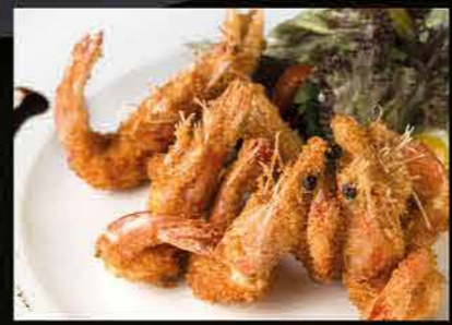
روبيان مقلي FRIED PRAWNS DHS. 45.00

وجبة بحرية مشكل خاصة MABROOK SPECIAL SEAFOOD PLATER SUITABLE FOR 15 PERSON DHS.800.00