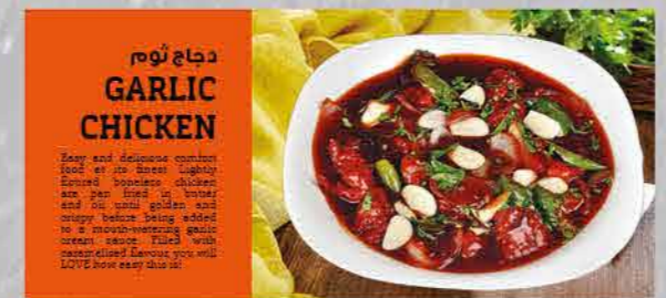
دجاج ثوم GARLIC CHICKEN

Chilly chicken is a popular Indo-Chinese dish of chicken of Hakka Chinese heritage. In India, they may include a variety of dry chicken preparations. Through mainly, however, chicken is used in this dish, some people also use boned chicken too.