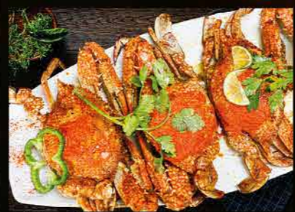
كراب مشكل GRILLED CRAB DHS. 45.00

مأكولات بحرية متنوعة عائلية FAMILY ASSORTED SEAFOOD AED.175 / 220 / 285 / 335