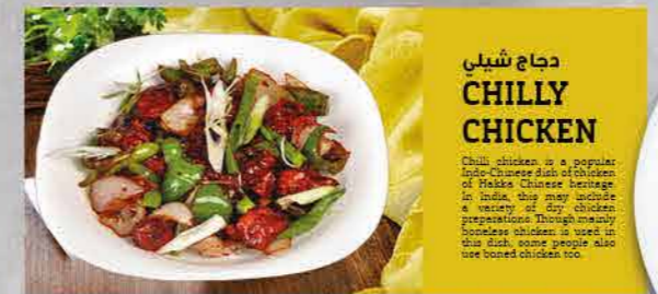
دجاج شيلي CHILLY CHICKEN

Chinese Dry Beef Chilli - Beef strips hot and fragrant Chinese dry beef chilli. Serve hot with boiled noodles or steamed rice.