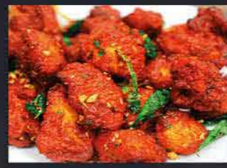
دجاج ٦٥ CHICKEN 65 Chicken 65 is a spicy, deep-fried chicken dish originating from Hotel Buhari, Chennai, India, as an entrée, or quick snack. The essence of the dish can be attributed to red chilies, but the exact set of ingredients for the recipe can vary.