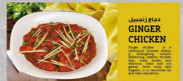
دجاج زنجبيل GINGER CHICKEN

Easy and delicious comfort food of the West. Lightly breaded chicken, chicken, can pan fried in butter and oil until golden and crispy before being added to a mouth-watering garlic sauce. Tired with your usual? Give you will LOVE how easy this is!