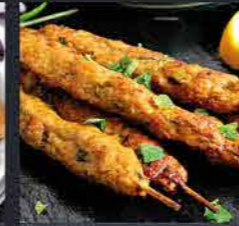
كباب اصابع FINGER KABAB Finger Kabab, also known as chicken tenders, chicken goujons, chicken strips or chicken fillets, are delicious meat prepared from the premium muscle portions of the animal.