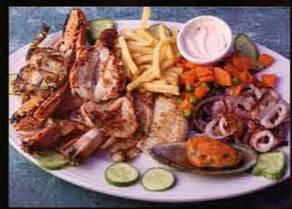
بحرية مشكل MIX SEAFOOD DHS. 95.00