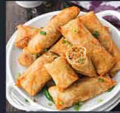
لفائف ربيع SPRING ROLL Spring rolls are a large variety of filled, sealed appetizers or dim sum found in East Asian, South Asian, Middle Eastern and Southeast Asian cuisine.